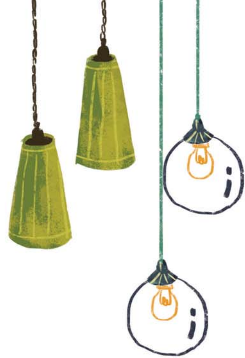
Grace membeli lampu cantik.