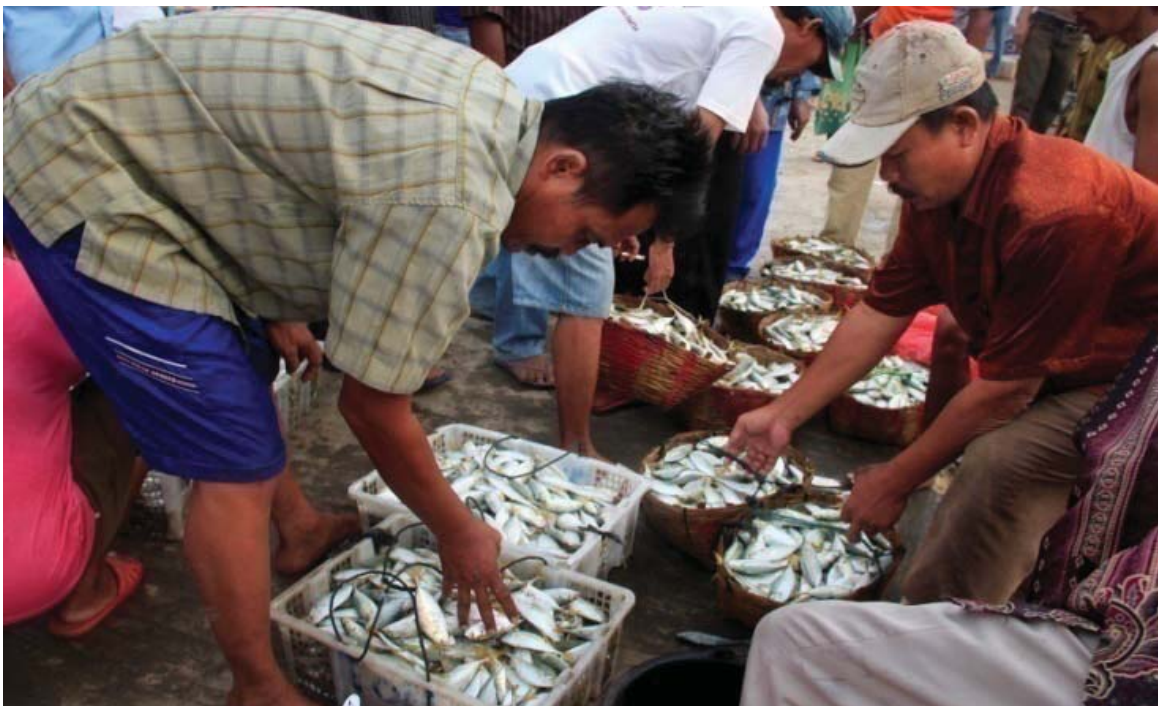
Suasana penjualan ikan di Karangantu

“Terima kasih, Pak, sudah mengantar kami,” ujar panca sekawan ini begitu mereka turun di pasar pelelangan ikan.