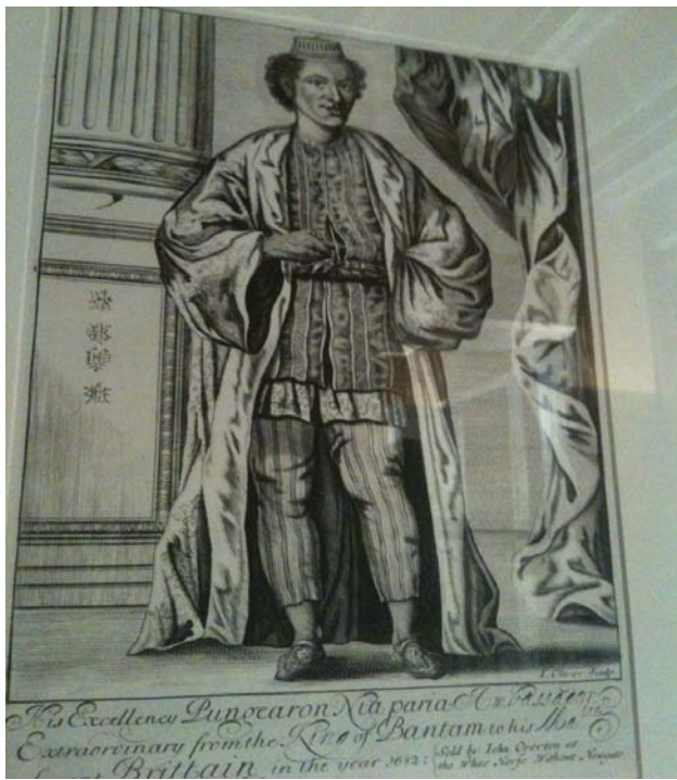
Gambar: Kyai Ngabehi Pangeran Naya Wipraya, Duta Besar Banten untuk Inggris dalam pakaian resminya, 1682.

Masjid, alun-alun, makam raja, pasar alit (kecil), dan Istana Surosowan adalah pusat tempat sultan Banten bertakhta dan menjadi pemimpin duniawi sekaligus spiritual. Yang kedua adalah kanal-kanal yang saling menghubungkan tempat-tempat penting dan yang mengairi persawahan serta terhubung hingga Pelabuhan Karangantu. Yang ketiga adalah lokasi bagi pemeluk agama non-Islam dan orang-orang muslim dari Cina, bangunan yang berwujud masjid pecinan dan wihara, tempat sembahyang bagi penganut agama Buddha dan Konghucu. Ada pula permukiman orang Inggris dan orang asing lain. Selain itu, Benteng Speelwijk (baca: Spilweik) adalah sebuah benteng Belanda yang keberadaannya memang menjadi tempat Garnisun Kompeni Belanda.